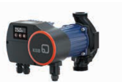
Calio Pro – Dişli