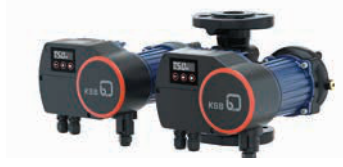
Calio Pro Z – Flanşlı İkiz Pompa