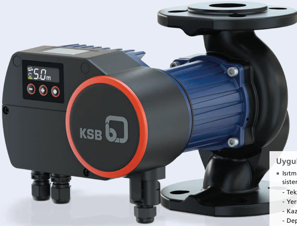
Flanşlı Calio Pro