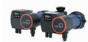
Calio Pro Z – Dişli İkiz Pompa